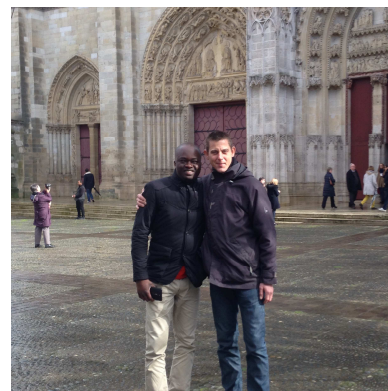
Appel décisif des catéchumènes à la collégiale de Mantes-la-Jolie dimanche 5 mars